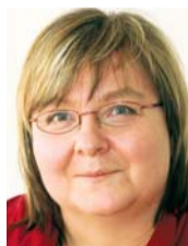
Von Beate Möschl

kommt da so einiges in den Sinn. Auch die Regierung reagiert feinsinnig: Sie lockert mal eben die Regeln für Hartz IV – von Selbstbehalt bis Zuzahlung. Ein regionalisierter Hartz-IV-Satz wie ihn der Ifo-Chef im Sinn hat, würde zusätzlich wie Hefe im Kuchenteig wirken: Die Ballungsräume können aufgehen ohne Ende durch die Schar getriebener Bürger, die selbst für mehr Sozialhilfe bereit wären, ihre strukturschwache Heimat – in Ost wie West – zu verlassen. Eine neue Art des Zusammenwachsens entsteht. Überforderung auf der einen und Entvölkerung auf der anderen Seite würden folgen. Und dann? Mal ehrlich, wir haben doch mehr drauf!